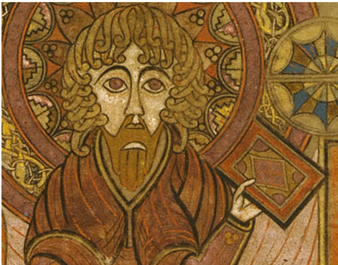
凯兰书卷（或译凯尔经，Book of Kells）