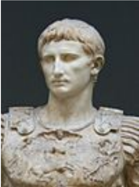
奧古斯都(屋大維) 前27年—14年